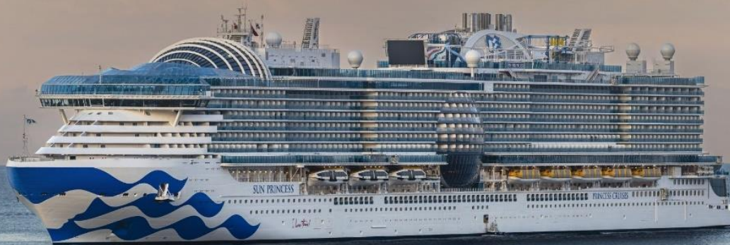
*ภาพเพื่อประกอบการโฆษณาเท่านั้น

รายการทัวร์ เมืองที่เรือจอด รวมถึงเวลาการเดินทางในแต่ละวัน อาจเปลี่ยนแปลงได้ตามความเหมาะสม โดยไม่ต้องแจ้งให้ทราบล่วงหน้า เนื่องด้วยสภาพอากาศ หรือเหตุการณ์ไม่คาดคิด ที่มีผลกับรายการเดินทางข้างต้น ทั้งนี้หากมีการเปลี่ยนแปลง ทางบริษัทฯ จะคำนึงถึงความปลอดภัย และผลประโยชน์ของลูกค้าโดยส่วนรวมเป็นหลัก