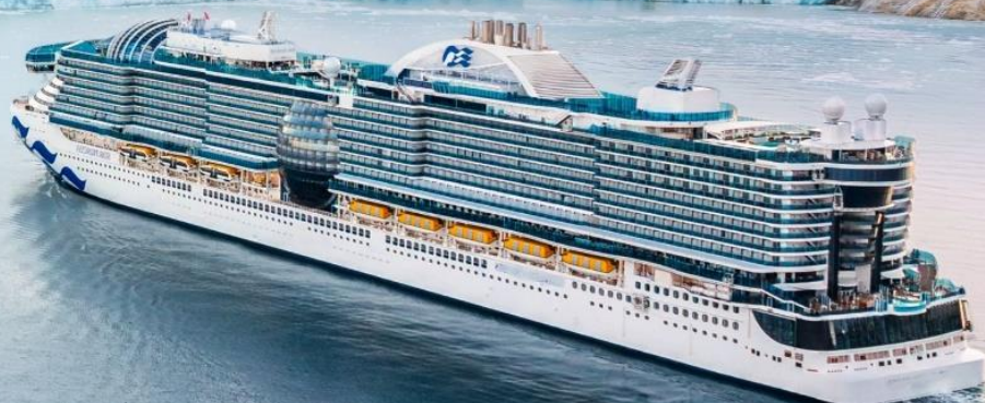
*ภาพเพื่อประกอบการโฆษณาเท่านั้น

*Business Class Flight Ticket กรุณาสอบถามเจ้าหน้าที่อีกครั้ง