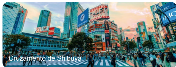
Cruzamento de Shibuya

Nota: Tempo livre durante a visita para almoçar.