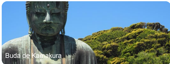
Buda de Kamakura