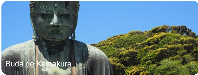
Buda de Kamakura