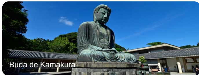
Buda de Kamakura

16 Agosto – Visita de Kamakura y embarque